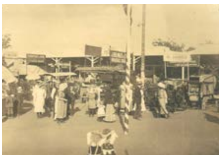
Částečně kryté strojího oddělení na Bucharově zahradě, 18. 8. 1911