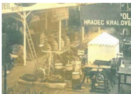
Část strojího oddělení, Jindřich Poskočil