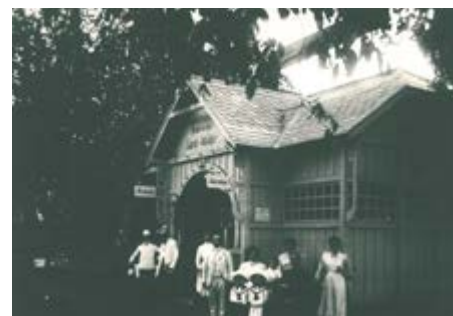
Pavilon Cukrářství Karla Havlíka

Uzávěrka příštího čísla (červen): čtvrtek 21. 5. 2026 ve 12.00