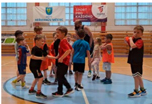
Naše nejmenší basketbalové naděje