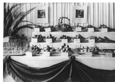
Expozice ovoce velkostatku Kinských, Krajinská výstava 1911