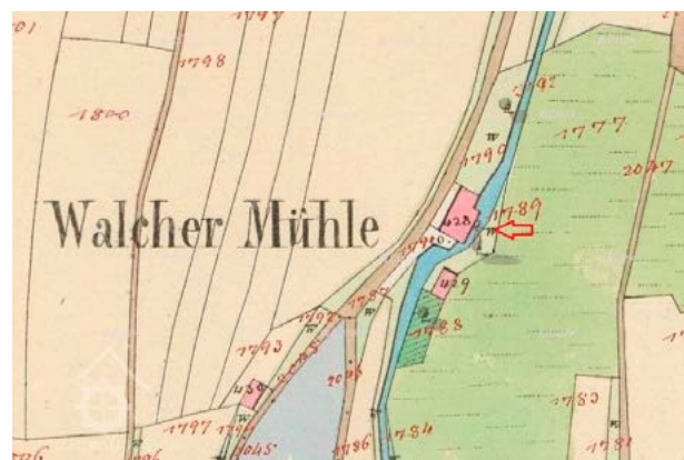
Císařský povinný otisk, výřez, 1839