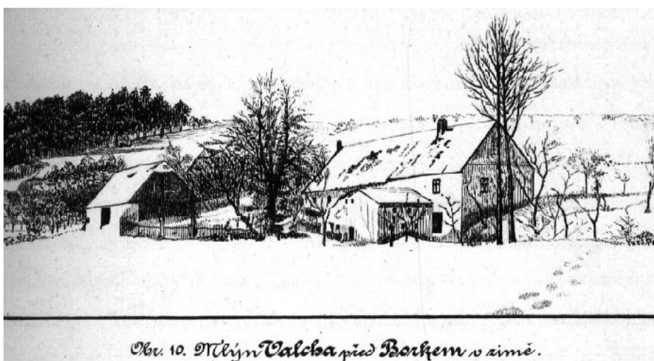
Obv. 10. Mlýn Valcha před Borhem v zimě.