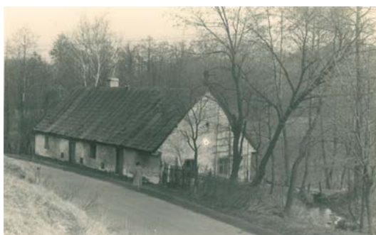
Valcha v 50. letech 20. století