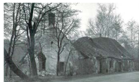
Rozpadající se mlýn v roce 1965