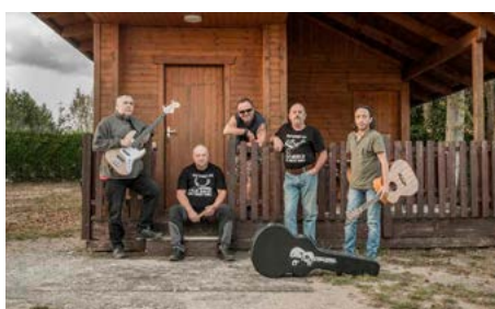
Kapela SAHARA BAND

K rybaření mě dovedl můj strýc z Kostelce a naučil mě základy, které by měl každý rybář mít.