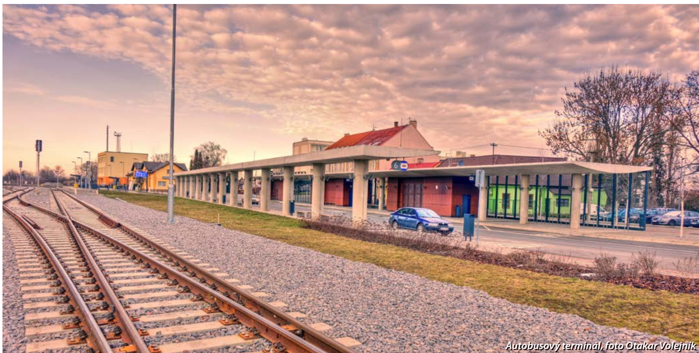
Autobusový terminál