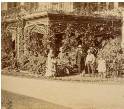
Skupinový portrét před zimní zahradou zámku