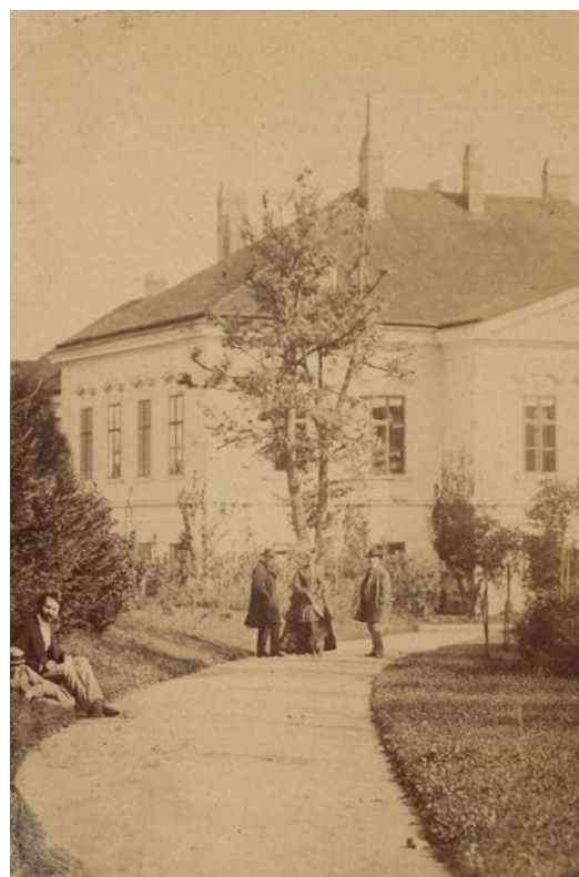
Roh jižního a západního křídla budovy zámku

Uzávěrka příštího čísla (březen): čtvrtek 19. 3. 2026 ve 12.00