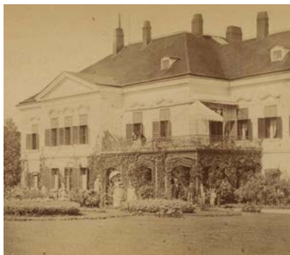
Západní část zahradního průčelí zámku v Heřmanově Městci