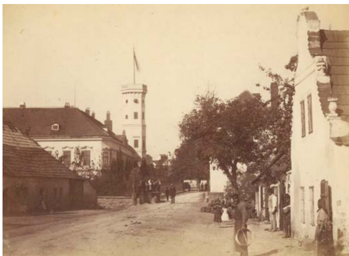
Pohled k zámku od Chrudimi, v popředí na obou stranách městská zástavba