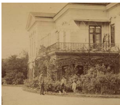
Pohled podél západní části zahradního průčelí se zimní zahradou zámku