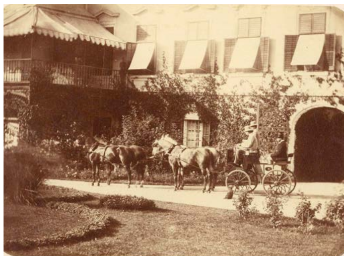
Koňské čtyřspřeží před zahradním průčelím zámku v Heřmanově Městci