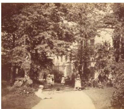
Pohled z parku na zahradní průčelí zámku