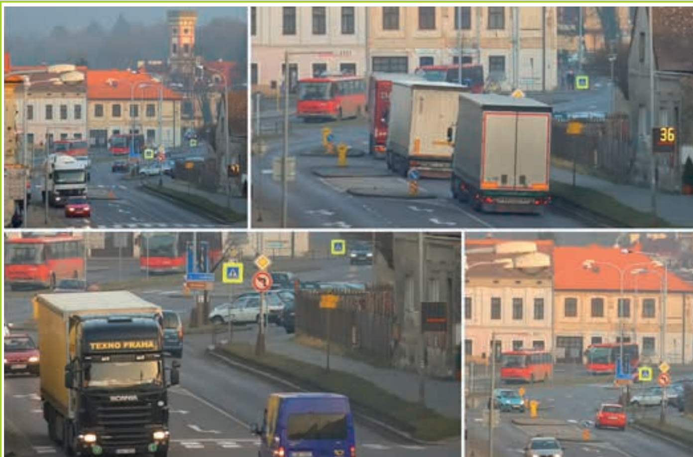
přetížená doprava v Heřmanově Městci